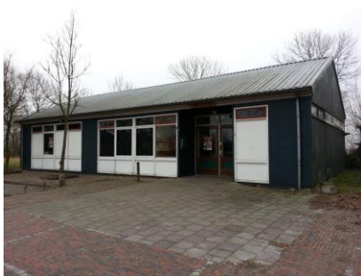
Jeugdsoos Wehe den Hoorn