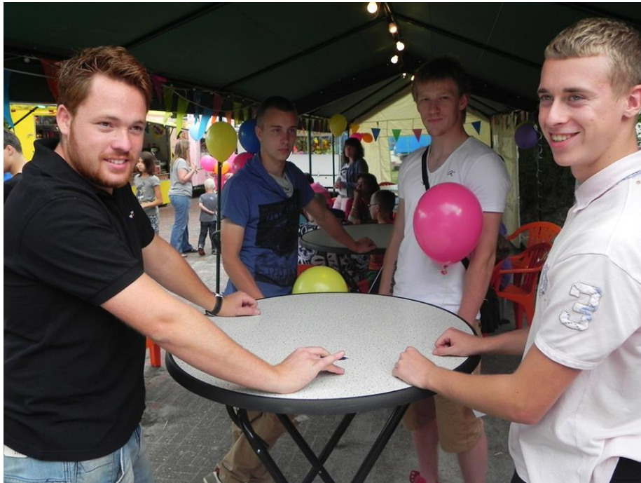
Kermis in Wehe den Hoorn, (mede) georganiseerd door jongeren