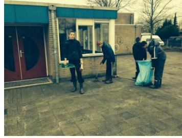
Bij hangplek Zoutkamp