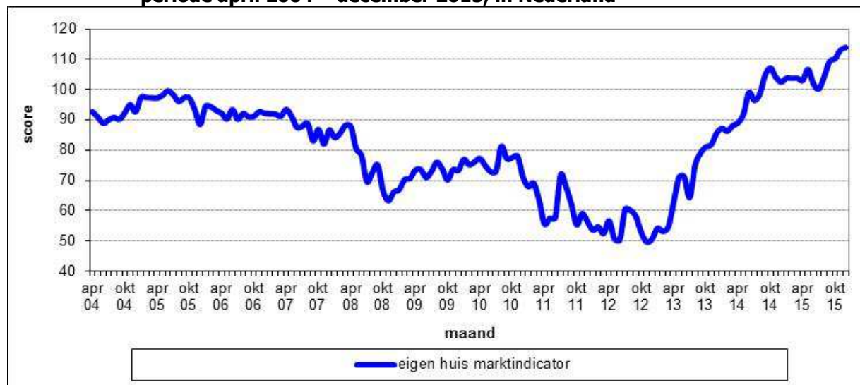
Figuur 2.1 De gemiddelde scores op de Eigen Huis Marktindicator, op maandbasis in de periode april 2004 – december 2015, in Nederland