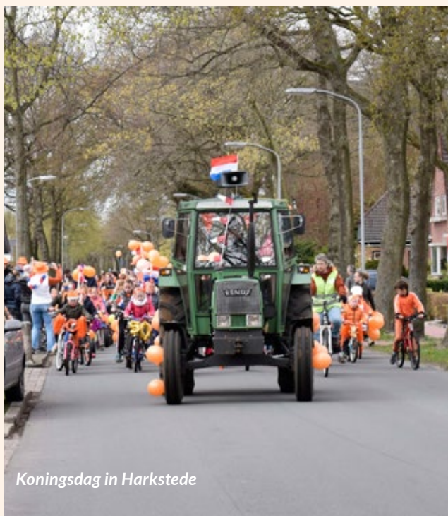
Koningsdag in Harkstede

Naast dit digitale platform worden er enkele informatieborden in het dorp geplaatst, zodat iedereen over de informatie kan beschikken. Op deze manier hoopt de werkgroep het verenigingsleven en de gemeenschapszin in het dorp te versterken. Met als doel om Harkstede en alles wat er in het dorp gebeurt, zowel voor de eigen inwoners als naar buiten toe, beter te promoten.